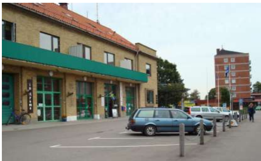
Nya butikslokaler vid Centralgatan nära Triangelplatsen och handelsstråket Storgatan

Genom greppet att omdefiniera centrum blev förutsättningar bättre för att fylla detta nydefinierade centrum med en koncentration av butiker. Butikslokaler på Övre har gjorts om till restauranger och bostäder och butiker har flyttat från Övre till Centrum, en process som fortgår.