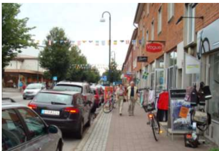
Storgatan väster om rondellen Triangelplatsen

Handeln i Höganäs centrum är koncentrerad till Storgatan och Köpmansgatan, från Triangelplatsen till Sundstorget, med vissa utvikningar runt detta stråk. I samråd med invånare och handlare omdefinierades centrum i början på 2000-talet till denna definition, tidigare hade Höganäs ett ännu mera utsträckt centrum från-torg-till-torg (Gruvtorget-Sundstorget, från Övre till Nedre). Förutom butikerna längs Köpmansgatan och nyss nämnda del av Storgatan ingår också butikerna runt Kyrkplatsen samt vid Centralgatans anslutning till Triangelplatsen i det som definieras som centrum. I direkt anslutning till centrum finns också stormarknaden City-Gross vid väg 112 och det växande shopping- och upplevelseutbudet i Höganäs Hamn, även Bruksgatan som leder upp mot Höganäs Design Outlet-området har fått en renässans genom att några nya butiker öppnats.