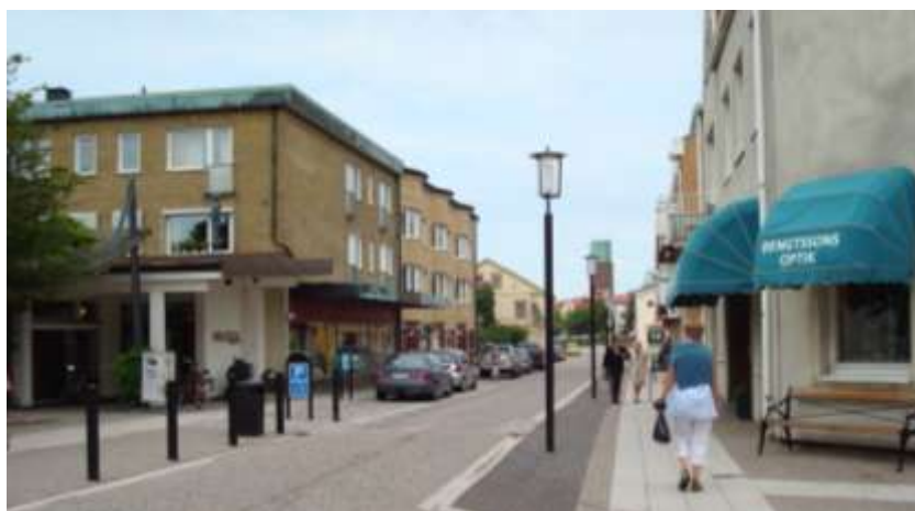
Köpmansgatan efter förvandlingen

I centrum finns det bara enstaka vakanser och i flera nybyggnadsprojekt planeras tillkommande butiksytor. Under senare år har ett tiotal nya butiksetableringar skett i centrum som sakta men säkert genomgår en modernisering. Flera intressenter har hört av sig och avser etablera sig när rätt lokaler finns tillgängliga. Höganäs centrum har alla möjligheter att få ett intressant butiksutbud för upplevelsehandel, där man lämnar bilen och strosar runt. Köpmansgatan har genomgått en förvandling etappvis de senaste åren. Tidigare var Köpmansgatan en vanlig dubbelriktad gata, nu är den enkelriktad, byggd i ett plan med genomtänkta detaljer och möbleringszoner. Omgestaltningen har planerats i nära samverkan mellan kommun, handel och fastighetsägare. Det är väl tillgodosett med parkeringsplatser i anslutning till centrum vilket är en förutsättning för utvecklingen.