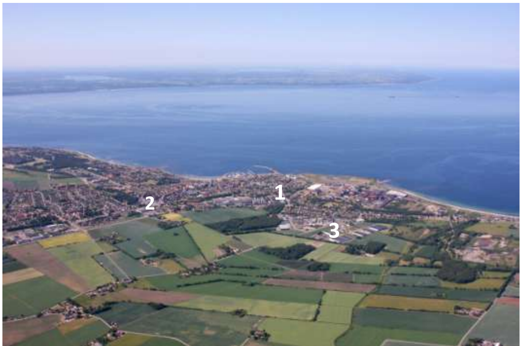
Korta avstånd mellan Höganäs centrum (1), stormarknad (2) och Höganäs Design Outlet (3)

Höganäs kommun växer och invånarantalet har ökat i flera orter vilket reser nya krav på tillgång till handel inom bekvämt avstånd.