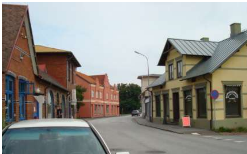
Bruksgatan med en del butiker och verkstäder binder samman centrum med Höganäs Design Outlet