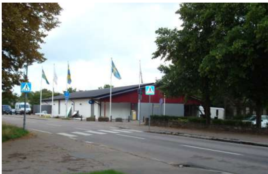
Närbutiken i Jonstorp utökas och moderniseras sommaren 2009

I tätorterna Viken, Nyhamnsläge och Jonstorp finns större livsmedelsbutiker. I Brunnby finns en välsorterad livsmedelsbutik som kan sägas serva Mölle och Arild, förutom Brunnby. I dessa orter finns förutom dagligvarubutiker också ett visst utbud av övriga butiker. Lerberget är en stor tätort som saknar butiker helt, närheten till Höganäs torde vara en del av förklaringen. I Viken som har vuxit mycket de senaste åren finns t.ex. ett femtontal butiker och flera restauranger. Lokalt producerad mat är populärt och många lokala producenter erbjuder direktförsäljning. Direktförsäljningen kan vara allt från obemannade, tag-självbodar för potatis och ägg till pittoreska butiker. Några butiker på landet har nästan saluhallskaraktär, där flera lokala producenter samsas. Detta utbud ger både kvalitet för kommunens invånare, men är också en del i utbudet för besökare. Eftersom allt fler sådana butiker uppstår blir tillgängligheten för lokala livsmedel bättre och bättre.”